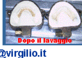
Dopo il lavaggio