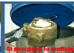
Si posiziona la muffola