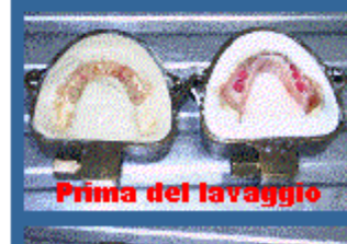
Prima del lavaggio