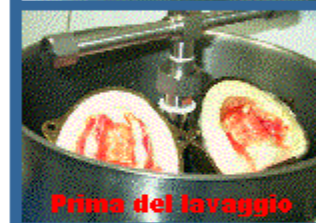
Prima del lavaggio