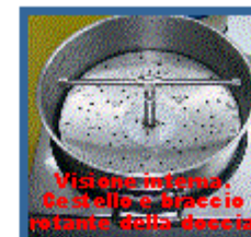
Visuale interna. Cestello e braccio rotante della doccia

CERA WASH ha un funzionamento molto semplice. Sul pannello frontale sono posizionati l'interruttore e due manopole, una per l'azionamento del TIMER DOCCIA (tempo regolabile da 1 a 15 minuti) ed una per regolare la temperatura dell'acqua per il lavaggio (da 30 a 100 C° e comunque sempre verificabile tramite l'oblo del termometro)